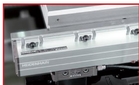
Lineární stupnice Heidenhain