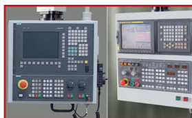
Ovládací panel Fanuc / Ovládací panel Siemens