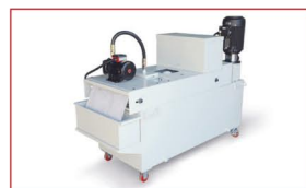
Systém CTS papírového filtru